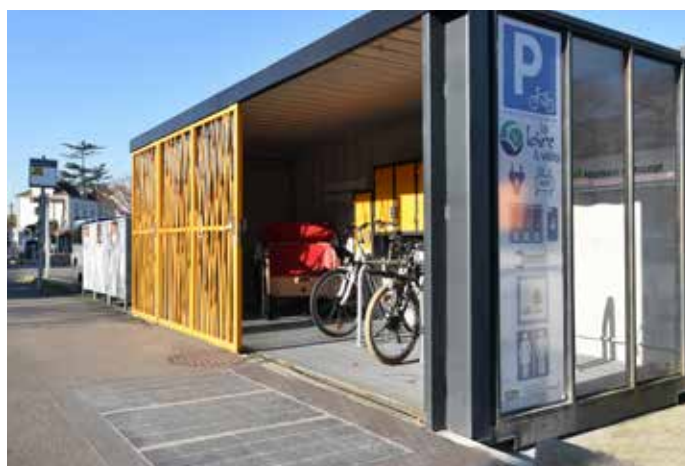
El aparcamiento protegido para bicicletas Nielsen Concept Mobilités es energéticamente autosuficiente gracias a Wattway Pack